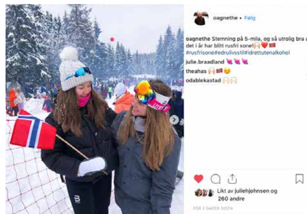
Flere delte bilder fra rusfri sone på Instagram.