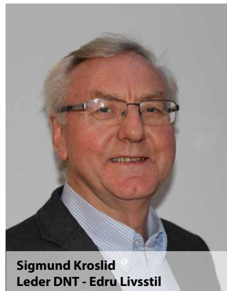
Sigmund Kroslid Leder DNT - Edru Livsstil