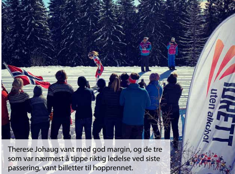
Therese Johaug vant med god margin, og de tre som var nærmest å tippe riktig ledelse ved siste passering, vant billetter til hopprennet.

- Den første natta, natt til fredag, var det ensomt. Det var kun meg i Rusfri sone, mens det i flere av leirene rundt var full fest. Natt til lørdag dunket musikken høyt fram til ca. halv tre, men vi fikk være i fred. Området vårt ble heldigvis respektert. Folk var grytidlig i gang lørdag morgen med musikk og drikking! I natt var det nesten ingen igjen i Camp Steinalderåkeren, og under 3-mila i dag var det vi som sto for den beste festen, musikken og stemningen!