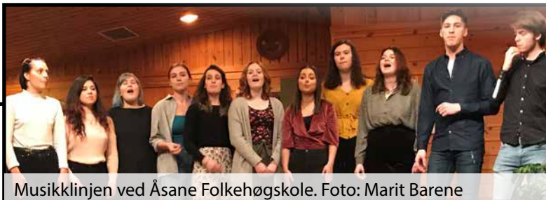
Musikklinjen ved Åsane Folkehøgskole.