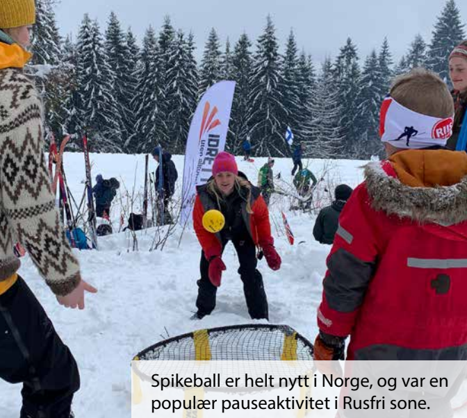
Spikeball er helt nytt i Norge, og var en populær pauseaktivitet i Rusfri sone.