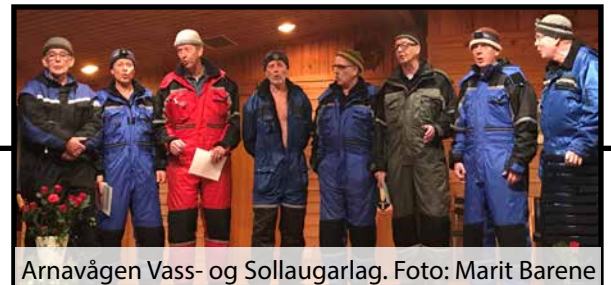
Arnavågen Vass- og Sollaugarlag.