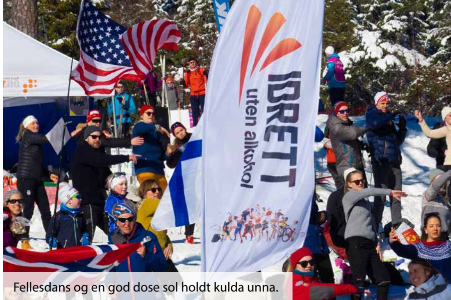
Fellesdans og en god dose sol holdt kulda unna.