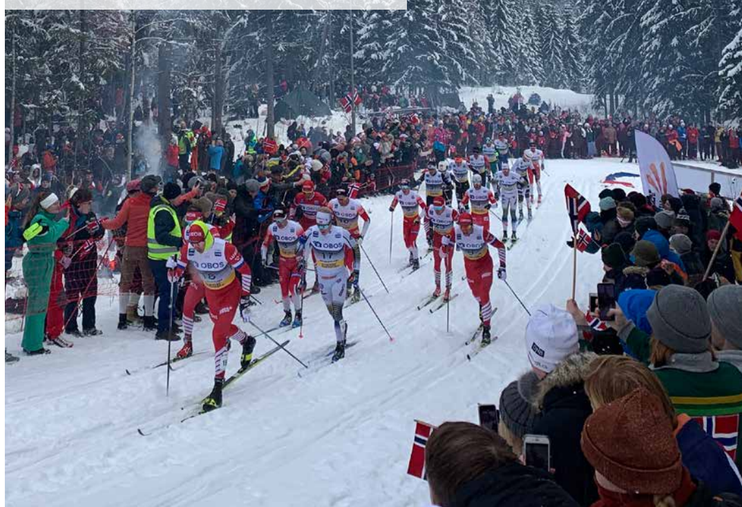
Ingen gullmedalje til Norge under 5-mila, men toppscore til Rusfri sone både lørdag og søndag!