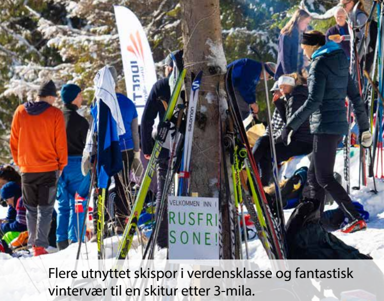
Flere utnyttet skispør i verdensklasse og fantastisk vintervær til en skitur etter 3-mila.